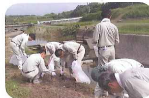
廃棄物管理部の職員も清掃活動に積極的に参加

お問い合わせ先 廃棄物管理部 管理課 tel 059-328-2567 fax 059-328-2967