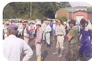
参加された住民の方々

我が廃棄物管理部は、新小山最終処分場が位置する小山町周辺などの清掃活動へは、これからも積極的に参加し、併せて、最終処分場の管理に当たっても、周縁緑地帯の維持管理と美化に努めてまいります。