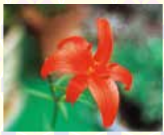
ヒメユリ 葛山博次 著 「万葉集の植物」より

ここに詠まれたヒメユリは、ヤマユリの小形のものとも考えられますが、ヤマユリをユリの名で歌われていることから、現在のヒメユリを考えるべきでしょう。万葉の時代にはどの程度生育していたものかわかりませんが、現在は、近畿地方から西の本州、四国、九州にまれに自生し、満州、朝鮮、中国、アムール地方に分布しています。園芸種でもまわっています。初夏に濃いオレンジ色の花をつけます。万葉集には一種のみです。