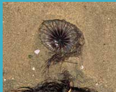
アカクラゲ し どく のこ 死んでも毒が残っている