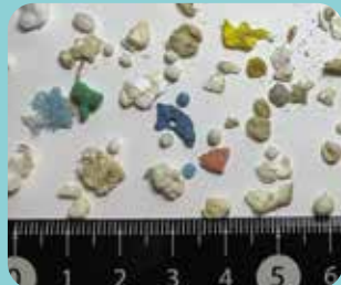
はっぽう 発泡スチロール ぎょぐ はっぽう 漁具や発泡スチロー ルのはこから出る