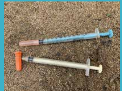
ちゅうしゃき はり 針がついたものが落ちている