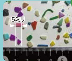
こうしつ 硬質プラスチック せいひん プラスチック製品がこわ れてこまかくなったもの