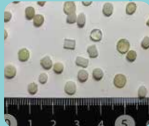
レジンペレット せいひん ざいりょう プラスチック製品の材料