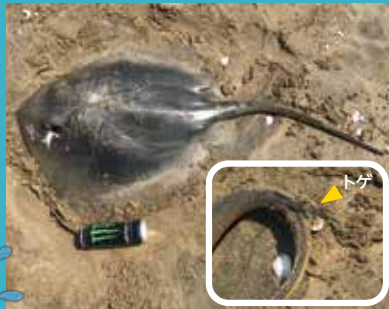
アカエイ お 尾にトゲがある